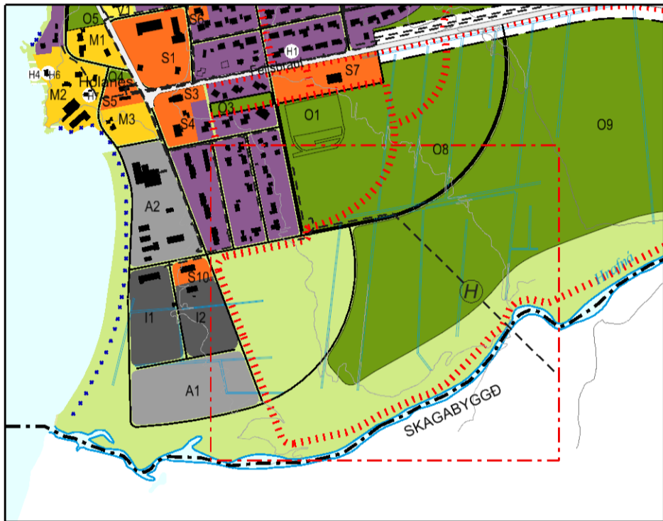
Tillaga að breytingu á aðalskipulagi Skagastrandar 2010-2022.