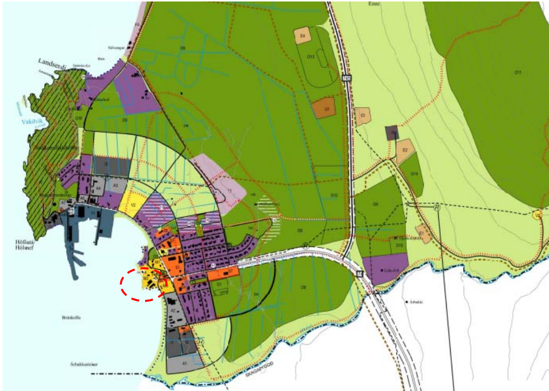
Mynd 4. Hluti af upprætti Aðalskipulags Skagastrandar 2010-2022. Breyting afmörkuð með rauðu.

Unnið er að endurskoðun Aðalskipulags Skagastrandar 2019-2031 þar sem gert er ráð fyrir sjóböðum á umræddu svæði. Ekki er talin þörf á að breyta gildandi aðalskipulagi þar sem sjóböð og sú starfsemi sem þar mun fara fram henta skilgreiningu miðsvæðis.