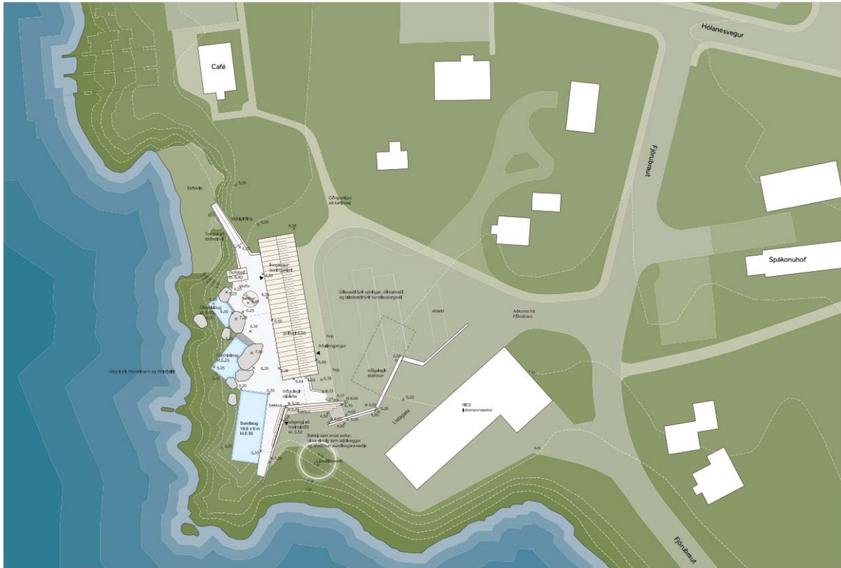
Mynd 6. Skýringarmynd sem sýnir helstu áform og fyrirkomulag á svæðinu. (Mynd Arkþing 2021)

Laugasvæðið er um 900 m 2 . Innan laugasvæðis er heimilt reisa kaldar og heitar laugar, potta og gufubað ásamt hvíldaraðstöðu með möguleika á því að komast niður í fjöruborðið.