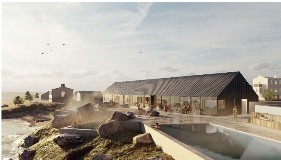
Mynd 7. Möguleg ásjón eftir uppbyggingu. (Mynd Arkþing / Nordic, ágúst 2021)

Umsvif og stærðargráða framkvæmdanna sem deiliskipulagstillagan tekur til er ekki talin valda verulegum umhverfisáhrifum. Öll umgjörð og starfsemi verður þannig háttað og hönnuð með sjálfbærni í fyrirrúmi, að hlífa náttúrunni og valda ekki álagsskemmdum á svæðinu. Við allar framkvæmdir skal fyllstu varúðar gætt og taka skal fullt tillit til náttúru staðarins. Áformin sem deiliskipulagsbreytingin fjallar um á ekki að hafa áhrif á aðliggjandi hverfisvernd strandlengjunnar þar sem laugasvæðið mun að mestu vera fyrir utan það en að einhverju leyti felld inn í klettóttu ströndina og getur þannig myndað gott samspil með hverfisverndinni. Skammt frá breytingarsvæðinu er Hólanesvör og munu áformin ekki hafa áhrif á þær minjar en þegar hefur landslagi verið breytt talsvert á þeim stað og búið að koma upp brimvarnargarði.